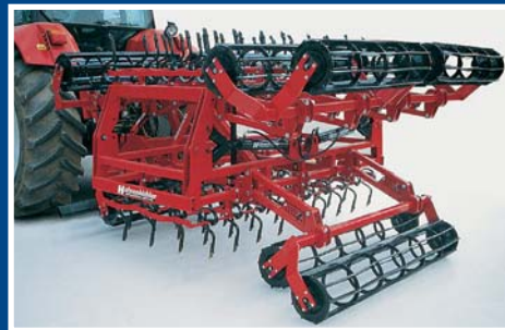
4,5 m Nivelator in Transportstellung, Paketklappung (keine frei schwingenden Teile beim Transport)