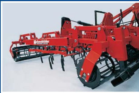
Spindelverstellbares Planierschild – Sprossenwalze als Vorkrümmler – 5 Zinkenreihen – Doppelkrümmler – Rückverfestigung