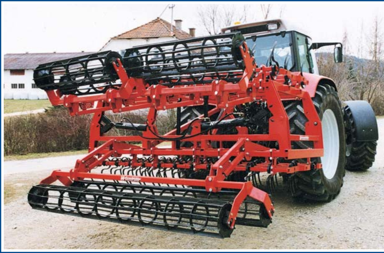
Nivelator, 5 m, in Transportstellung.