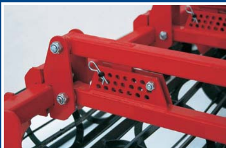
Einfaches und präzises Verstellen der gewünschten Arbeitstiefe