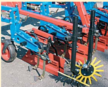
Einfache, vielfältige Einstellmöglichkeiten der Hacksterne.