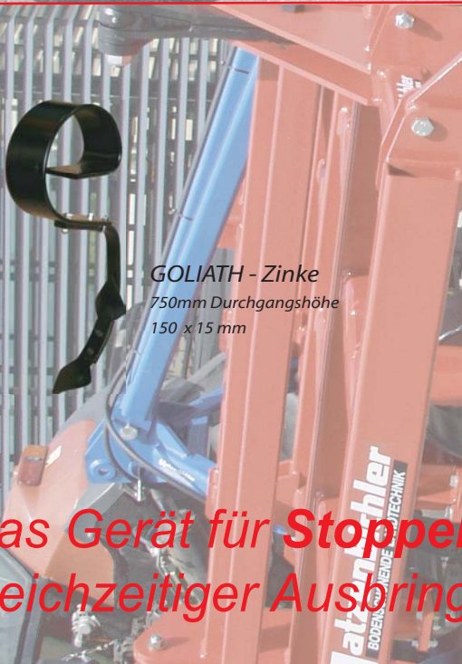
GOLIATH - Zinke 750mm Durchgangshöhe 150 x 15 mm